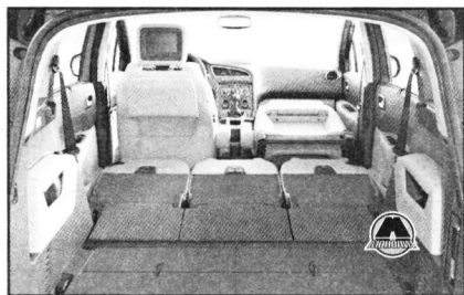
Багажный отсек Peugeot 5008 может вмещать от 758 л (при сложенных сиде-

Минимальный объем багажника Peugeot 3008 составляет 432 л, а при складывании задних сидений полезное пространство увеличивается до внушительных 1604 л. При этом в подполье багажника остается место даже для полноценного запасного колеса. Доступ в багажник кроссовера можно получить через двустворчатую пятую дверь.