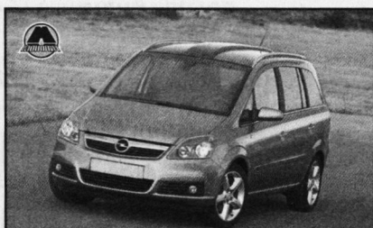
Zafira до рестайлинга (с 2005 - 2008)

Второе поколение Opel Zafira (под этим же именем автомобиль выпустили марки Vauxhall, Chevrolet и Holden) было представлено весной 2005 года на автосалоне в Женеве. Автомобиль построен на новой, заметно выросшей платформе. Конструкторами был полностью переработан дизайн кузова. Значительно увеличились габаритные размеры, по отношению к предшественнице: длина с 4,32 м увеличилась до 4,47 м, ширина прибавила 4 см, а высота – 1 см.