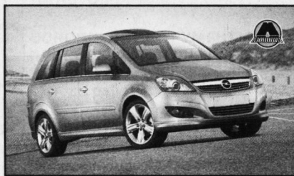
Zafira после рестайлинга (с 2008 по 2011)

Предлагаемая линейка двигателей включает четыре бензиновых мотора: 1,6-литровый 105-сильный, 1,8-литровый 140-сильный, 2,2-литровый 150-сильный, а также двухлитровый турбированный мощностью 200 лошадиных сил. Также на автомобиль могут быть установлены три турбодизеля объемом 1,9 литра мощностью 100, 120 и 150 л.с.